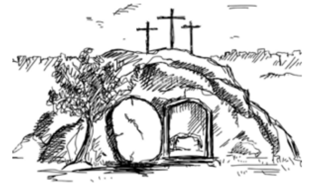
Mort et résurrection de Jésus-Christ