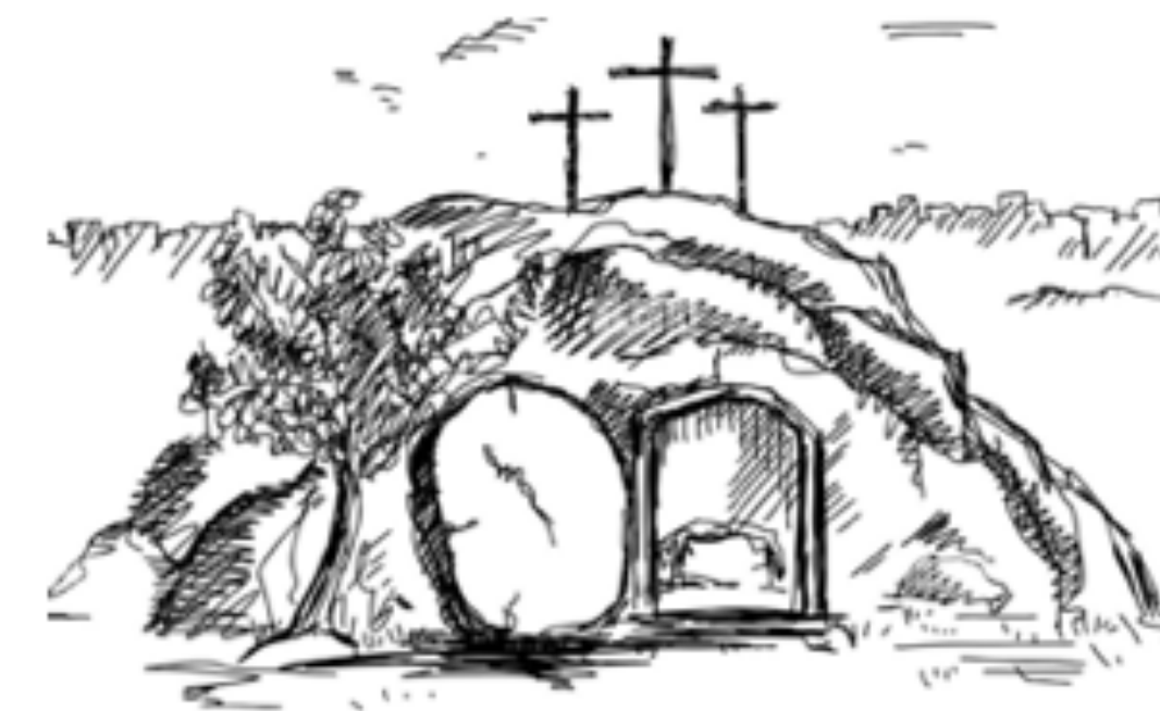
Mort et résurrection de Jésus-Christ

La Parole est devenue un homme et il a habité parmi nous. Nous avons vu sa gloire, la gloire qu'un Fils unique, plein du don de la vérité, reçoit du Père.